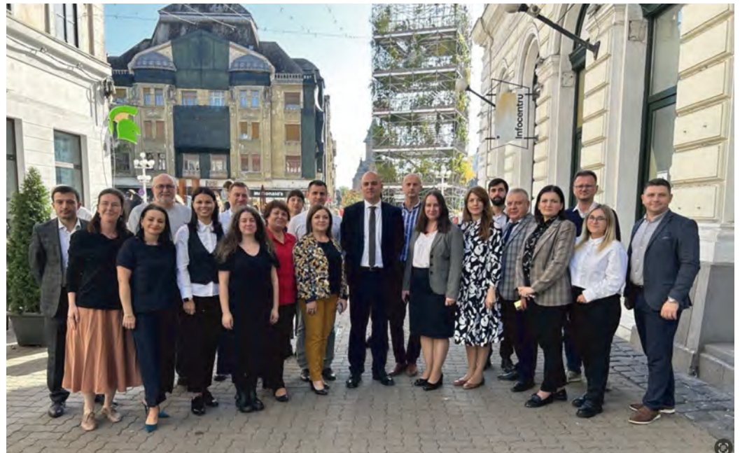
Imaginea 6. Echipa delegației din Republica Moldova împreună cu dl Matei Creiveanu – administratorul public al municipiului Timișoara

Managerii de cartier: asigură legătura dintre Primărie și problemele și inițiativele de schimbare ale celor care locuiesc, muncesc, au afaceri sau fac voluntariat în cartierele din Timișoara. Fiecare dintre ei este responsabil pentru două sau trei cartiere, și le cunoaște problemele, proiectele de dezvoltare, planurile urbanistice și mediază dialogul dintre cetățeni și diferitele structuri ale Primăriei. Sunt recrutați prin concurs și salariați de Primărie.