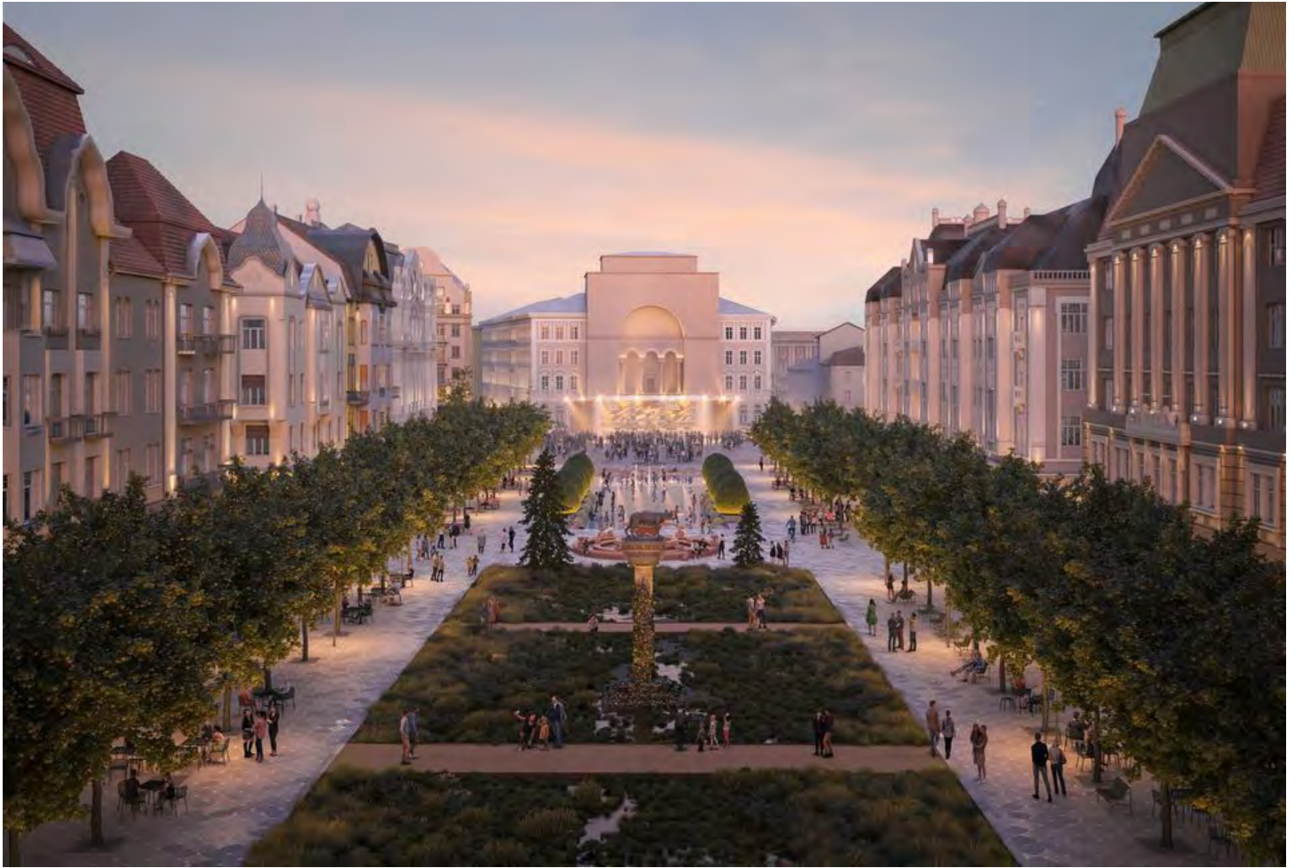
Imaginea 4. Soluția câștigătoare, Studio Arca (RO)