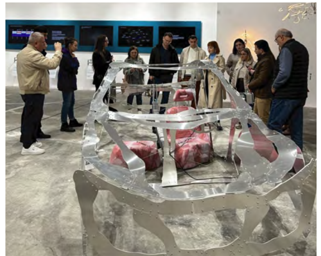
Imaginea 3. Expoziția Semnalizatoarele - Designul nu este un panou de indicatori oferă o perspectivă asupra ecosistemului de producție și cercetare industrială și design din Timișoara.