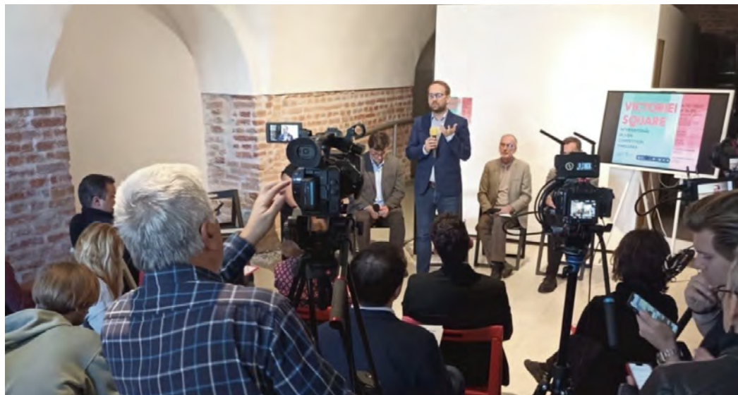
Imaginea 5. Primarul Timișoarei Dominic Fritz anunță câștigătorii concursului pentru Piața Victoriei

Participanții au ajuns la concluzia că luarea deciziei asupra unei soluții arhitecturale sau urbane pentru anumite locuri prin competiție promovează creativitatea și asigură calitatea investițiilor publice. Datorită juriului internațional format din profesioniști și consultări publice desfășurate în faza de redactare a documentației de concurs, nevoile cetățenilor găsesc soluții special adaptate. Parteneriatul cu asociațiile profesionale precum Ordinul Arhitecților aduce atractivitatea atât de necesară minților din toată Europa pentru a dezvolta soluții creative și unice.