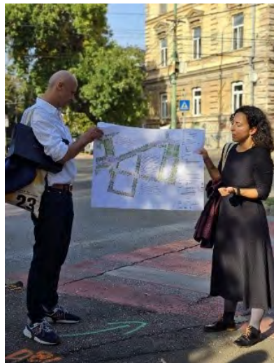
Imaginea 2. Remodelarea spațiului urban oferă mai multă infrastructură verde și facilități pietonale

În acest sens, FABER este un exemplu pentru valorificarea fostelor situri industriale din locațiile orașului. FABER este un centru cultural independent, fondat de un grup interdisciplinar de antreprenori locali. Încrederea în potențialul Timișoarei și dorința de a contribui la consolidarea industriei creative din oraș i-au reunit în 2017, când au decis să achiziționeze depozitul industrial din complexul AZUR și să îl transforme în clădirea FABER. La FABER au fost abordate rezultatele unui studiu aprofundat al ecosistemului de producție și inovare al economiei locale, combinând în mod unic analiza economică cu un afișaj în format expozițional. „Turn Signals - Design is not a Dashboard” este o expoziție în cadrul Programului Bright Cityscapes despre industria Timișoarei, principala forță economică a orașului, de peste 200 de ani. Analizând exemplele impresionante, grupul a putut reflecta asupra modului în care sectorul privat și civic contribuie la transformarea unei zone urbane și modul în care cultura este un factor definitoriu pentru consolidarea comunității într-un oraș cu o moștenire explicit tehnică și orientată spre știință care generează o producție vibrantă și o economie specifică.