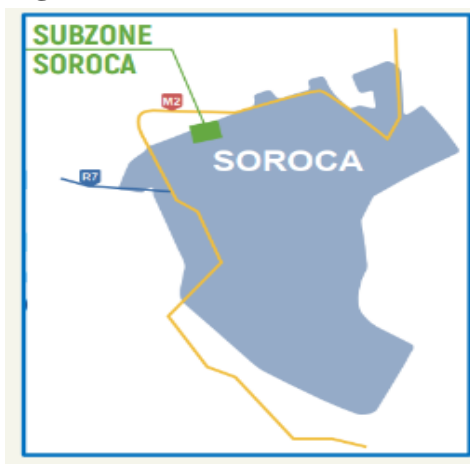
Figura 3: Subzona Soroca

Dezvoltarea sub-Zonei Economice Libere din Soroca este declarată o prioritate națională, sprijinirea acestui proiect fiind inclusă în Programul Național de Dezvoltare a Orașelor – poli de creștere, aprobat prin Hotărârea Guvernului Republicii Moldova nr. 916/2020 din 16.12.2020