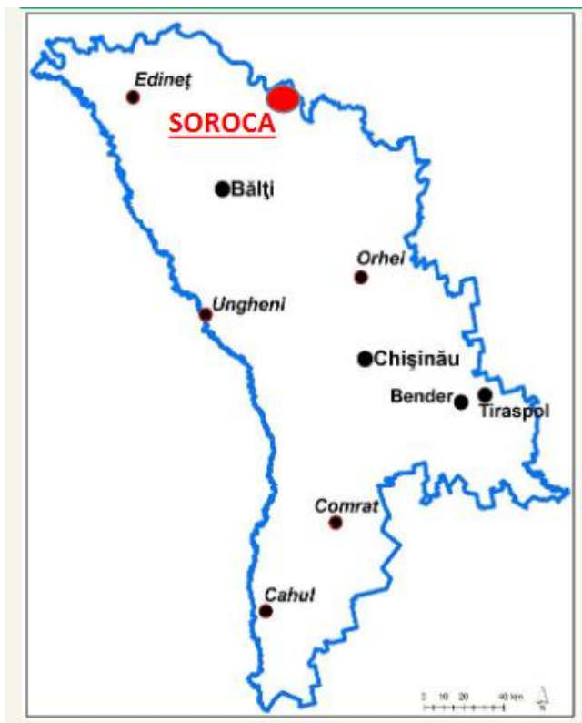
Figura 1: Localitatea mun. Soroca pe harta Republicii Moldova

Ca amplasare geografică, municipiul se află la o distanță de 160 km de mun. Chișinău și 165 km de Aeroportul Internațional Chișinău. La o distanță de 45 km se află Aeroportul Internațional Mărculești, specializat în transport de tip cargo.